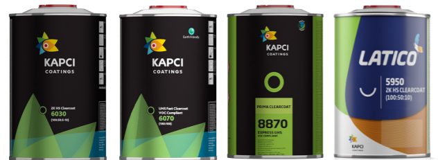
Kapci 6030/40/50/70/80 • Prima 8870 Latico 5950