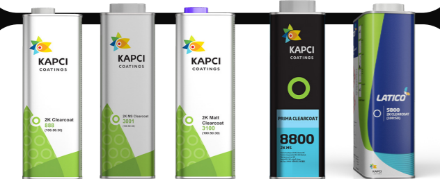
Kapci 888/3001/3100/3200/3300 Kapci 3100Matt/3150Matt • Prima 8800 Latico 5900/5860/5850/5800/5920