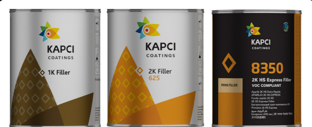
Kapci 625/626/630/633/634/635 Kapci 1K Filler • Prima 8350