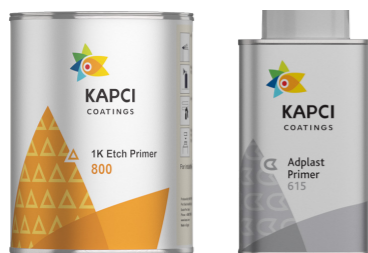
Kapci 800/805/810/820/870/873/875/880 Kapci 615 Adplast Plastic