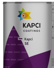
Kapci SE Synthetic enamel