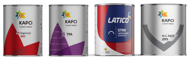
Kapcicryl • Kapci TPA Laticocryl • NC Topcoat